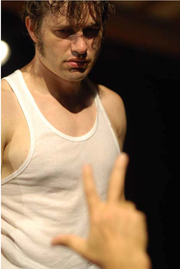
Rudi (Olivier Luppens) "Les Vivants et les Morts" - Photo de répétition

« Regarde-toi dans une glace et demande-toi si tu es un homme libre. Ne me dis pas que j'emploie les grands mots, que je devrais écrire, que je déraile. J'emploie les mots qu'il faut, c'est tout. Un, tu n'as rien à toi : ta maison, elle est à la banque ; le jour où ils ferment le robinet, t'es à la rue. Deux, en théorie tu peux aller où bon te semble, en réalité, comme tu n'as pas un sou devant toi, t'es bien obligé de rester là où tu es ! Je ne te demande pas où tu vas en vacances, je connais la réponse : tu restes là, t'es assigné à résidence. Trois, tu travailles pour gagner tout juste ce qui te permet de survivre, rien de plus. Et si tu t'avises de te plaindre, le peu que tu as on te l'enlève pour t'apprendre les bonnes manières. Alors tu la fermes parce que ta baraque, ta femme, tes gosses... Alors d'accord, t'es pas fouetté T'es pas vendu sur le marché T'as le droit de vote et le droit d'écrire dans le courrier des lecteurs de « La Voix » que tu n'es pas d'accord avec ce qui t'arrive, T'as la liberté d'expression ! Quelle liberté ? Tu sais bien que si tu écrivais une lettre pour dire vraiment ce que tu penses et si tu l'envoyais, ce serait comme si tu rédigeais publiquement ta fiche d'inscription à l'ANPE. Crois-moi : si tu veux bien regarder de près, ta vie ne vaut pas un pet de lapin, Tu ne comptes pour rien T'es un « opérateur » de production comme ils disent, Quelque chose entre l'animal de trait et la pièce mécanique... »